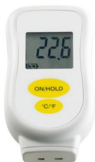
Digitales Messgerät 2515020-0013