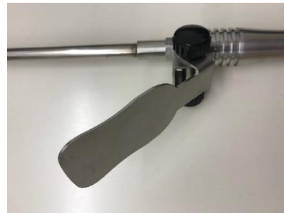
Typ 3151510 Gesamtdarstellung Einstechfühler mit kompaktem Handgriff aus Edelstahl und Handmessgerät Typ K mit Digitalanzeige und verstellbarer Halterung

Handmessgerät zum besseren Ablesen der Anzeige manuell einstellbar über Handrad