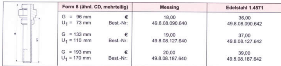
Form 8, 1.4571 poliert (Option)

Anmerkung: ggf. Wärmeübergänge und Energieabfluss berücksichtigen