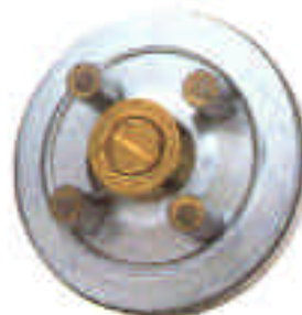
Type 0661 avec 4 aimants ( vue dos)