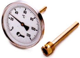
Type 0171 doigt de gant brillant poli (option)